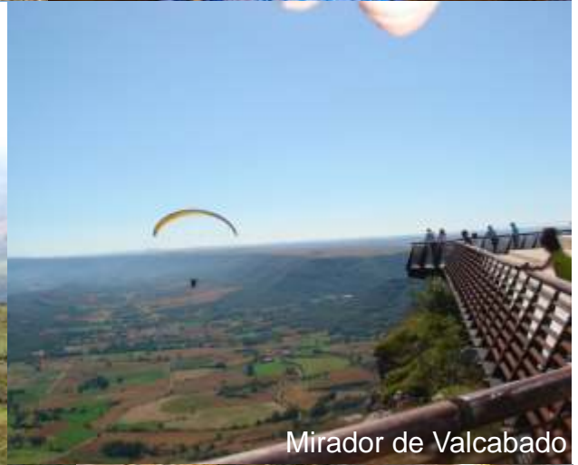
Mirador de Valcabado