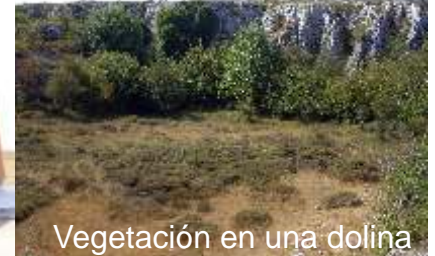
Vegetación en una dolina