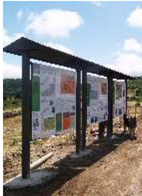
Punto de interpretación