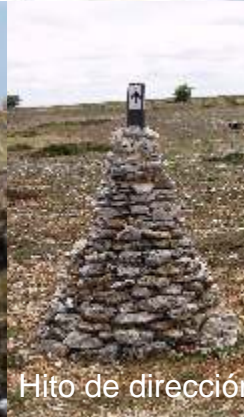
Hito de dirección