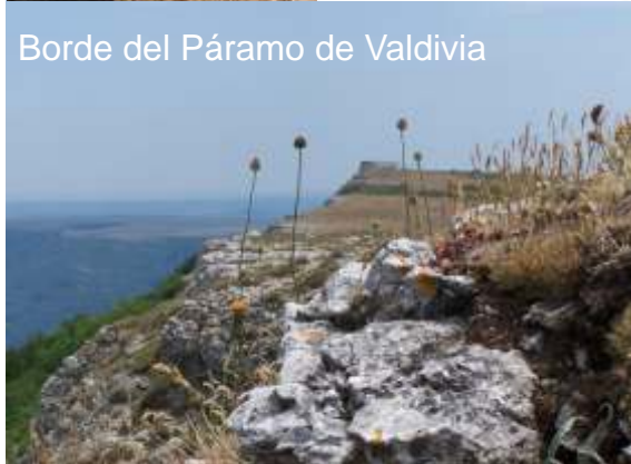
Borde del Páramo de Valdivia