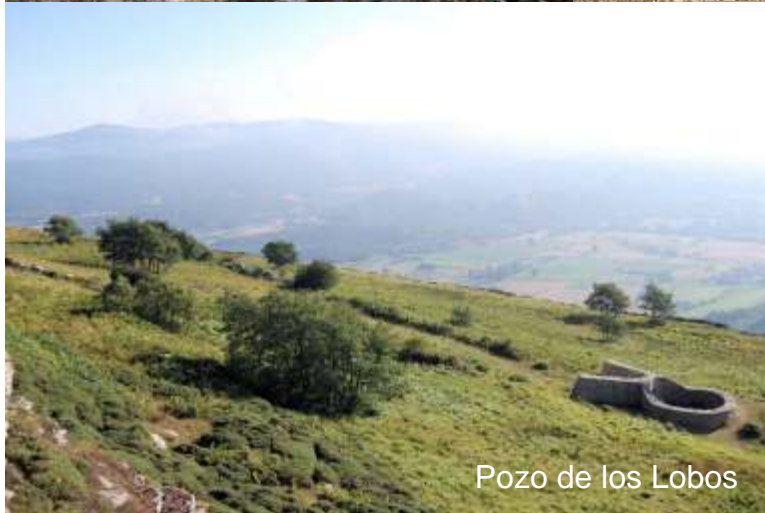
Pozo de los Lobos