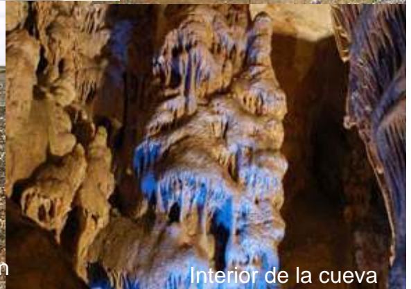
Interior de la cueva