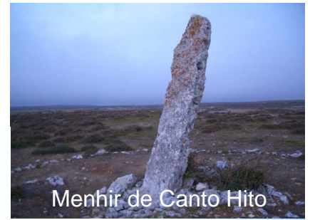
Menhir de Canto Hito